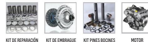
KIT DE REPARACIÓN KIT DE EMBRAGUE KIT PINES BOCINES MOTOR